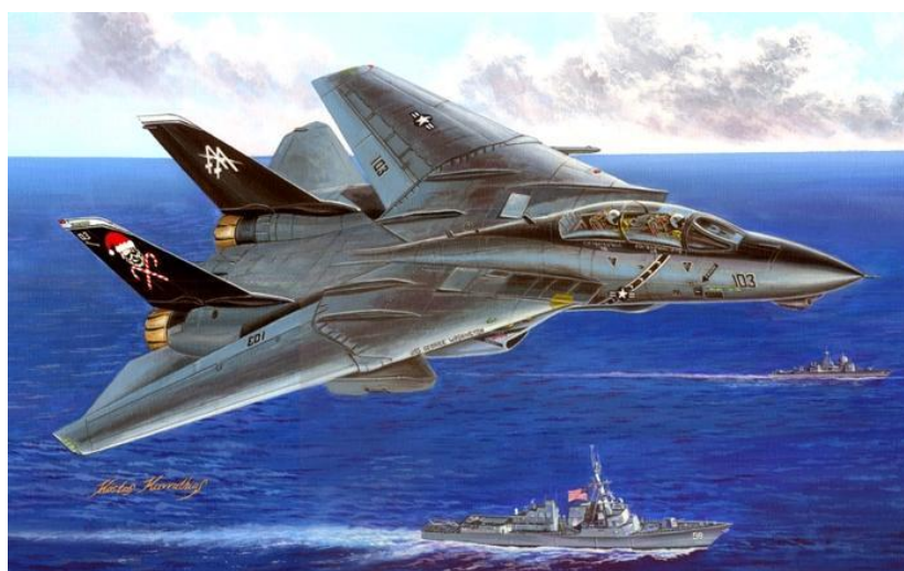
Art HB 80367 Scala 1:48 F14 B Tomcat (HB 80367) €70 € 59