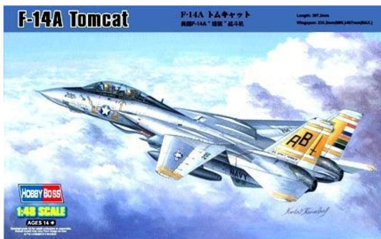
Art HB 80366 Scala 1:48 F14 A Tomcat (HB 80366) €70 € 59